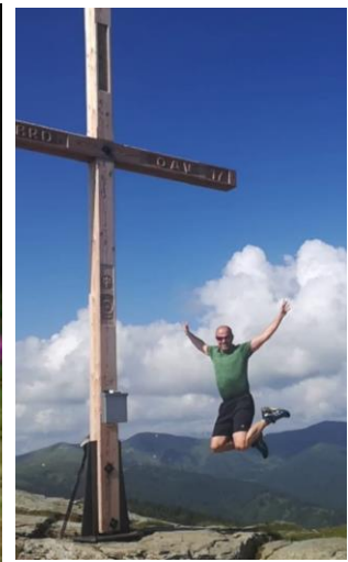
Frauenalpe – Hausberg