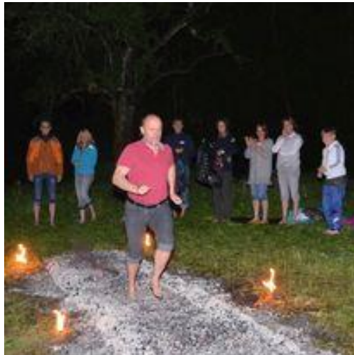
Prana goes Natur – Koppl