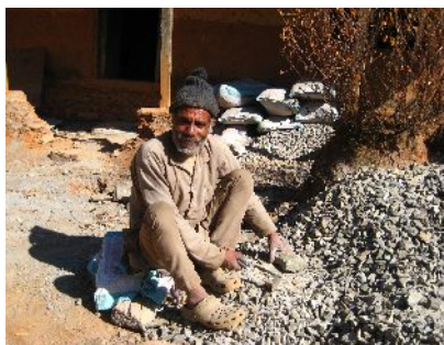
Steineklopfer mit Crocs ...